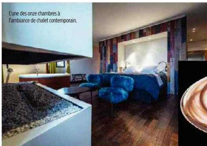
L'une des onze chambres à l'ambiance de chalet contemporain.

Tarte évanescence de chicorée maison, meringue presque brûlée. En bas, variation de betteraves avec ses voiles plissés, son palet cuit au barbecue, ses lamelles en croûte de sel et sa compotée d'oignons et féra fumée.