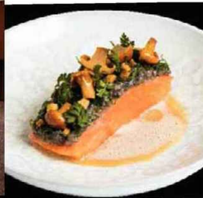
Truite sauvage confite du Léman, condiment d'escargots hachés, sauce au chignin-bergeron. L'envolée de champignons-saumur joue sur les contrastes de textures et de températures.