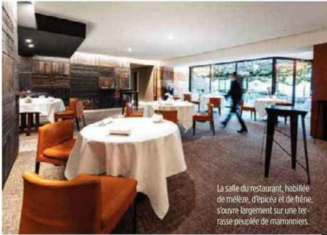
La salle du restaurant, habillée de mélèze, d'épicéa et de frêne, s'ouvre largement sur une terrasse peuplée de marronniers.